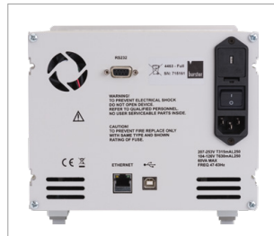
Rear view of device with connections